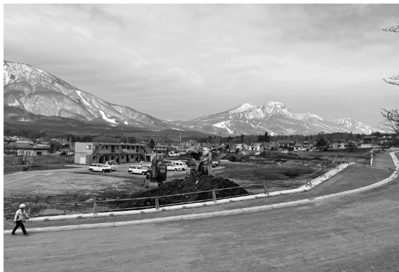
工事が始まった新病院

Q 病床数が減るのは理解しますが、外来人数を少なく見積もった理由は。 A 令和5年は5万人実績で令和6年は4万8千人の見込みです。減の要因は、他院から派遣の循環器内科の医師2名が、働き方改革で来ていただけなくなりました。かかりつけ医で患者が転院すると見込んでいます。 Q 医師が減ることは、問題です。根本的な改善策は。 A 働き方改革は、長野医療圏でも議題になっています。全国的な医師不足で、新たに医師が当院に来ていただくことは不透明です。圏域の病院で院長が