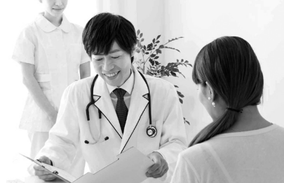
人間ドック助成を幅広く

響は。病院事務長 運営上・経営上影響が出てくると考えていますので、選ばれた病院として病院全体で考える必要があります。 質問 現在町では人間ドック受診に年齢を40・45・50・52・55・57・60・62・65・67・70歳と区切って対象としていて、75歳以上も後期高齢者は対象になっていません。 近隣市町村では、年齢の区切りもなく、その上75歳以上の後期高齢者も助成対象です。今回の変更に合わせて対象者の拡大は検討しましたか。 住民福祉課長 信越病院では、希望する方の受け入れ体制が若干厳しく、受診医療機関の拡大から進めていくとの結論になりました。令和6年度は受診状況を見極めて助成対象年齢と助成金額についても検討したいと思っています。 質問 人間ドックの助成額が下がって