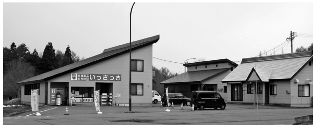
農林水産物等加工直売等施設 (いっさっさ)

〈指定の期間〉 令和6年4月1日～ 令和11年3月31日まで 信濃町ふれあい広場しなの指定管理の指定