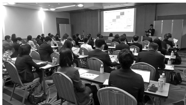
癒しの森サロン勉強会

Q 癒しの森サロンに毎年100万円ぐらいずつ委託料を払っています。提携企業の数と提携している宿