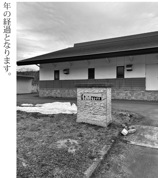
富濃浄化センター

人口減少の状況下にあつて下水道会計は一般会計からの繰り入れに頼った厳しい運営を行っています。農業、公共の使用が始まって令和6年3月時点で柏原、古間処理区は17年、富士里19年それ以外は25年から30