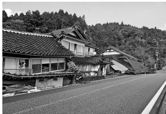
大震災の能登町のような

質問 年収入の1割以上が国保税。少し高いという認識では困ります。6年度の国保税は、基金から200万円投入し増税を回避しています。どうしてこうなるのですか。住民福祉課長 一番大きな要因は、被保険者数の減少によるものです。