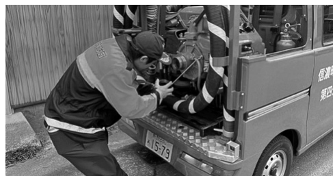
出動に備える消防団員

Q 班長の報酬(37000円)は国の基準どおりなのですか。 A 班長の報酬は現行で基準どおりですが、団員の報酬が基準を下回っていますのでそちらを引き上げます。