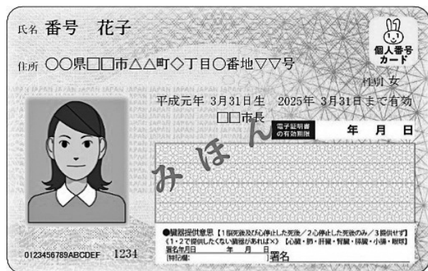
マイナンバーカード見本

Q マイナンバーカードにマイナ保険証の登録は進んでいますか。 A 正確な数は把握していませんが、半数以上は完了しています。 Q マイナンバーカードを取得していない方の保険証はどうなるのですか。 A マイナンバーカードを取得していない方には、資格確認書を発行します。