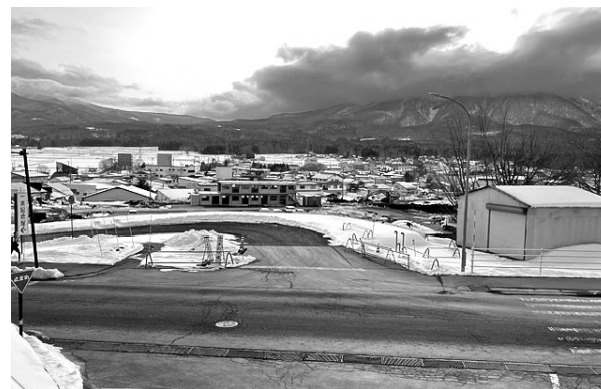
旧柏原小エリア予算の監視を強化

町長 貴重なご意見の宝の山でした。他に小学校の山での町への提言も素晴らしい、こういふ機会、ご意見を形にする事が私どもの役割です。 質問 職員からの案件を最終決断するのは町長、舵取りの役を担うわけですが、町長は聞く耳を持って職員と向き合いますか。