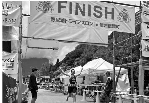
昨年のトライアスロン大会

【歳出】 ふるさと信濃町応援基金 4677万円の増 災害支援寄付金 1966万円の増 物価高騰対応非課税支援特別給付金 2700万円の増 物価高騰対応子育て支援特別給付金 1025万円の増 ほかに 新型コロナウイルス ワクチン接種委託 1050万円の減 新型コロナウイルス緊急経済対策利子補給 762万円の減 道路橋梁維持修繕除雪業務 1606万円の増 ほか