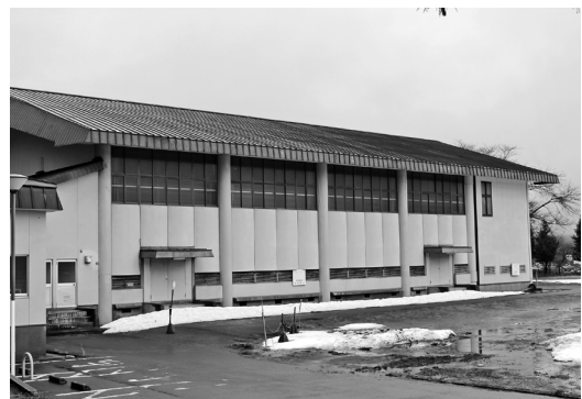
古間体育館の屋根の改修

Q 給食センターで、スチームコンベクションオーブンの入れ替えが予算化されていますが。 A 年代物の機種がかなり増えてきています。一年にひとつずつといった割合で、機械が壊れていなくても、耐用年数がたったものについては入替えができるよう予算要求していきます。 Q 古間体育館の修繕する箇所及び工事期間は。 A 床は研磨をして、ワックスをかければ維持ができれば維持は行いません。屋根は