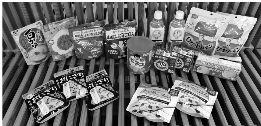
町の倉庫に保管されている備蓄食糧

張りともみならずか。産業観光課長 雨水や雪溶け水などの、一時的な湛水は除外します。 防災対策 質問 今回の地震で教訓等は生かされていますか。 総務課長 災害対応マニュアルの改定を行っています。 質問 備蓄食糧の確保と管理は。 総務課長 指定避難所4か所と役場に備蓄管理をしています。