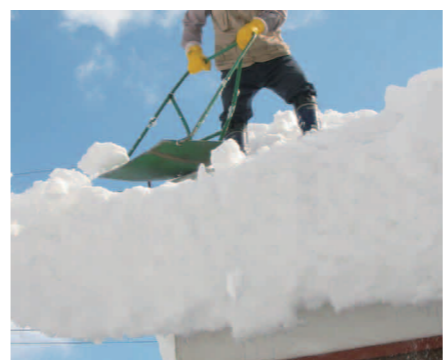
高所の雪下ろしは十分ご注意ください