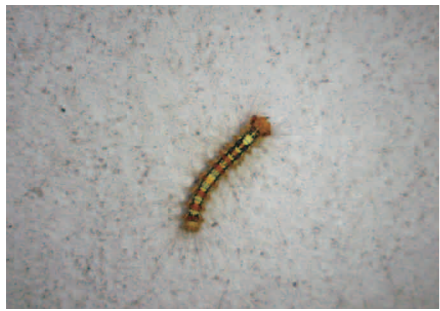
写真① 典型的な毛虫の様のマイマイガの幼虫

みなさんこんにちは、梅雨はじとジメジメしていても、動物や植物にとっては恵みの雨なのです。