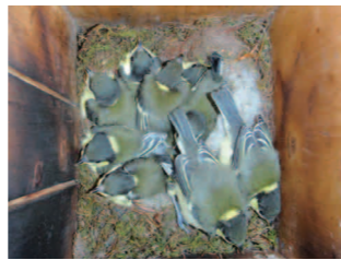
写真② 何羽いるかわかりますか? 9羽もいますよ!

ネが食べ、タヌキやキツネの糞が土にかえり、植物の糧になります。これが生態系の食物連鎖で絶妙なバランスで成り立っています。もしこの生態系のバランスが崩れると、生態系の底辺にいるものが大発生する傾向にあります。例えば、カエルや鳥が激減すると虫は捕食されなくなり、生存率が高くなります。生存率が低いことを見越して虫は、一つの親から大量の子供を作ります。その中の数%が生き残り遺伝子を残し種を維持しています。そのため多くの子どもが捕食されないと大発生するという現象が起きます。