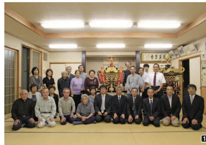
1 9月4日、古間東町の公会堂で入魂式が行われました。/ 2 東町組のピカピカの新しいお神輿。9月22日の秋祭りで披露されました。/ 3 町消防団員が火災時に安全・迅速に行動するための編み上げ長靴。

宝 くじの収益金を財源として、地域コミュニティの健全な発展のために活用されている「コミュニティ助成事業」。今年度は、古間東町組のお神輿の老朽化による新調に対して、(財)自治総合センターが実施する「一般コミュニティ助成事業」が活用されました。また、町消防団員が使用する編み上げ長靴 230 足の購入は、(公財)長野市町村振興協会が実施する「地域活動助成事業」を活用し整備を行いました。