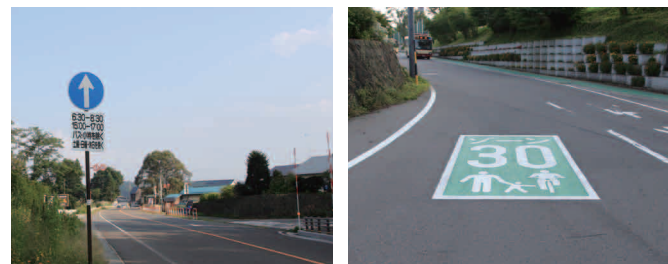
通学時間帯の通行規制標識(国道側) 路面標示(制限速度時速30km)

児童・生徒の登下校時の安全確保を目的として、学校周辺の道路がスクールゾーン(ゾーン30)に指定されています。具体的には、①制限速度時速30km(終日) / ②登下校時の車両進入禁止規制です。児童・生徒の安全のために、ご理解とご協力をお願いします。