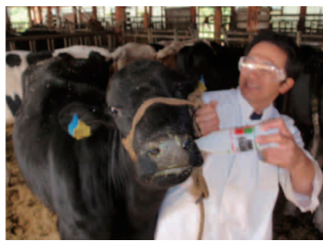
写真② 飲ませている所

できないので、強制的に飲ませなくてはなりません。犬や猫は、薬の錠剤を舌の奥に乗せて、お口を人の手で閉じて飲み込ませるのを待つ必要があります。牛は、人の手でお口を開けて、舌の奥にお薬を入れて、手で口を閉じさせます。人間の力より牛の力の方がはるかに強いので、人の手では抑えられないのです。牛にお薬を飲ませる方法は、ビール瓶のような形の容器を使います。昔はガラス製の瓶を使っていましたが、牛が奥歯で瓶を砕いてしまつと大変なことになるので、今は、プラスチックの容器を使っています。この容器は、水が1ℓほど入ります。この容器に錠剤であれば、水と一緒に入れて用意しておき、牛に頭絡をかけて、片手で牛の頭を固定しておき、また、牛の頭を固定しておき、片手であたりから、瓶をお口の中央に入れて、瓶の先を舌の上あたりに持っていけます。牛の瓶の先を舐める動きに合わせて、お薬を流し込みます。流し込む勢いが早いと、お薬がお口の横から下