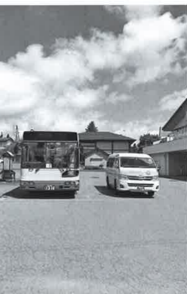
更なる交通システムの強化を

総務課長 ありません。質問 車を所有することの家計上の収支バランスとデマンド・タクシーの利用とを、そろそろ考えて欲しいと思います。デマ