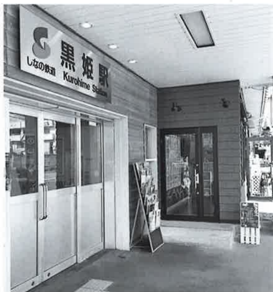
信濃町観光の起点はここから