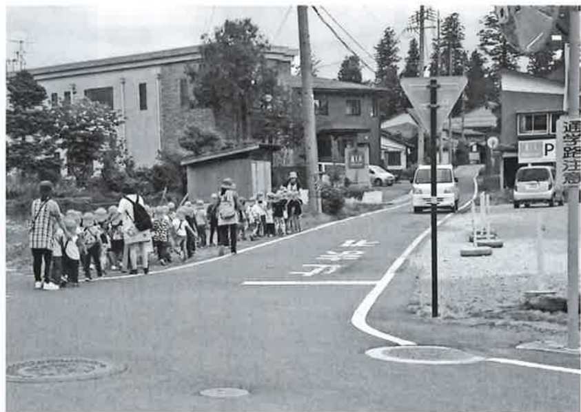
安全第一 柏原保育園の散歩

通学路は「子ども見守り隊」の名入りベストを作成し地域の方々に協力いただくお願いをしています。PTAでは6月29日に子どもと一緒に歩く「通学路歩こう隊」の取り組みを行ないます。