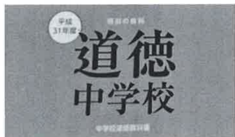
始まった道徳教育

※私は教育勅語の普遍的十二の徳目は現在のいじめや虐待、猟奇的な犯罪社会を取り巻く不道徳な行為を防ぐ唯一の手立てだと思っています。