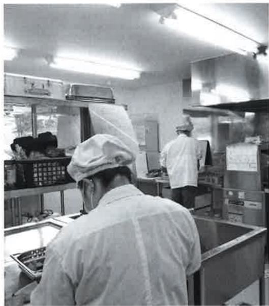
事業所で働くみなさん