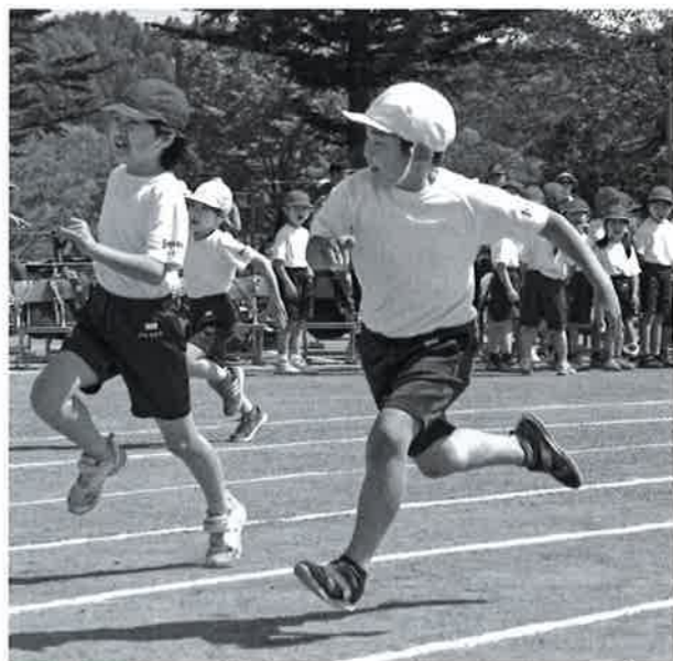
そよげそよげ わかたけ