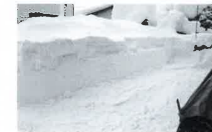
長い「けえだし」の除雪

住民福祉課長 自衛官募集事務ということで、自衛隊法第97条、自衛隊法施行令120条で資料提供を求められた上での判断で町では提供しています。 質問 確かに自衛隊法や施行令では自治体に対して、協力を求めることができる旨が明記されています。しかし自治体が行うべき義務は明記されていません。自衛隊法や施行令と、個人情報保護法や住民基本台帳法との整合性に関して、どのような認識ですか。