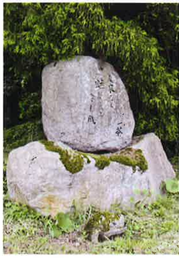
昭和63年建立 富士里 北川 遊漁様