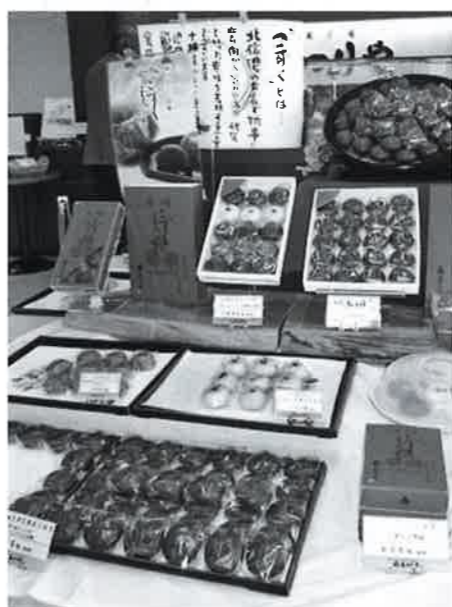
消費税の引き上げ中止を