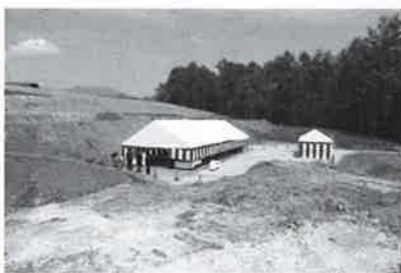
より広くなります