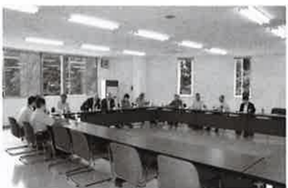
エムケー精工の仕事について聞く

雇用については、約3割にあたる47名が町内在住者で、15名ほどが消防団に加入しているとのこと