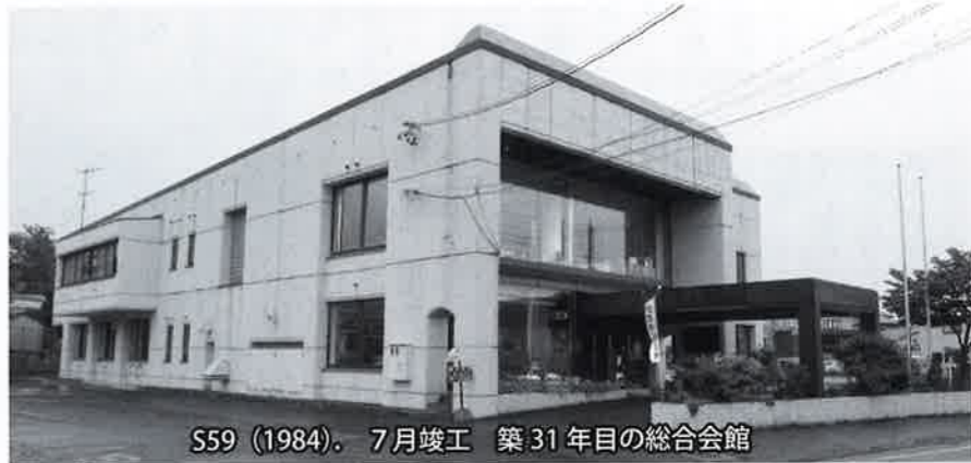
S59 (1984). 7月竣工 築31年目の総合会館

まさに管理計画に反映させるべき内容だろうと考えます。 質問 この計画は、公共施設長期維持管理計画という様なものですか。 町長 基本的には、今の(公共施設)長期維持管理計画という線が、一番強いだろうと思います。