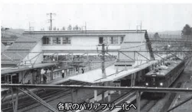
各駅のバリアフリー化へ

産業観光課長 乗降客はJR時期と変わりません。副町長 駅利用者などの観光の重要なデータとして調査等も考えています。