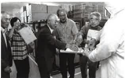
サンクゼールの おとうふドーナツを試食