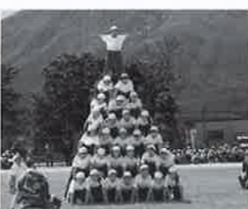
チームワークのかたち