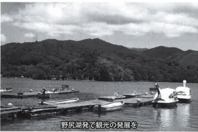
野尻湖で観光の発展を