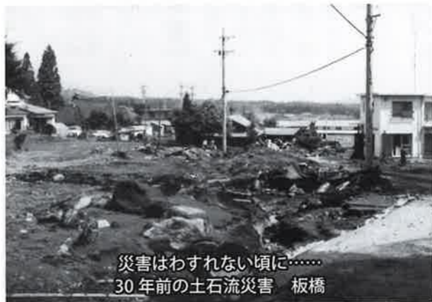
災害はわすれない頃に……30年前の土石流災害 板橋

質問 北信、板橋組の上流にある屏風沢の堰堤、土砂調査の結果は。 建設水道課長 県が6月中に行う予定です。 質問 土石流災害が心配です。対策は万全か。 総務課長 特別警戒区域の約