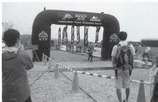
感動のゴールイン

6月27日(土)、黒姫高原にて、黒姫トレイルランニングレースが行われ、議長が表彰