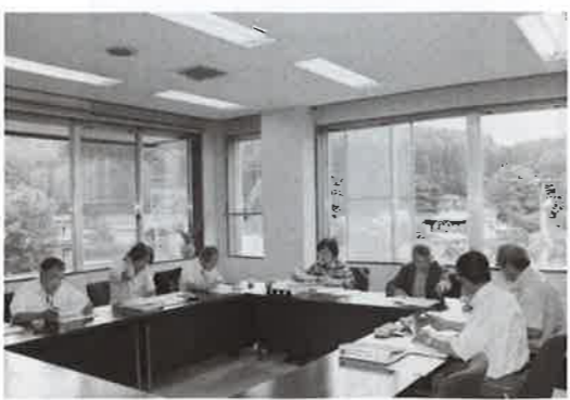
町民にとってより良い医療体制を話し合う

7月には滋賀県の全国市町村国際文化研修所で地域医療について研修を受けました。今後は、佐久穂町と佐久穂町立千曲病院の視察など予定が目白押しですが、