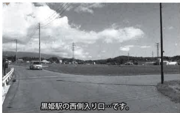
黒姫駅の西側入り口...です。