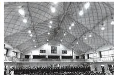
耐震工事が不要になった体育館