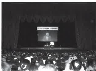
これからの町村議会は