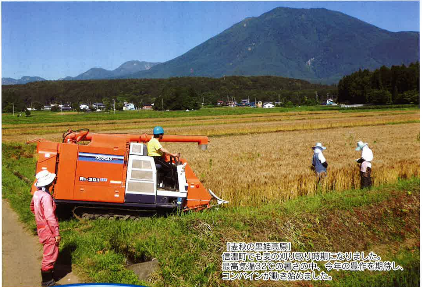
「麦秋の黒姫高原」 信濃町でも麦の刈り取り時期になりました。 最高気温32℃の暑さの中、今年の豊作を期待し、 コンバインが動き始めました。