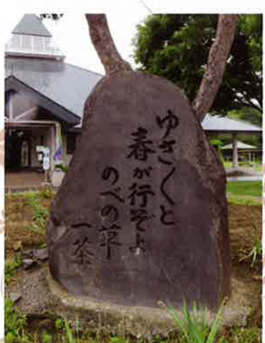
平成9年建立 信濃町碑の会外一同