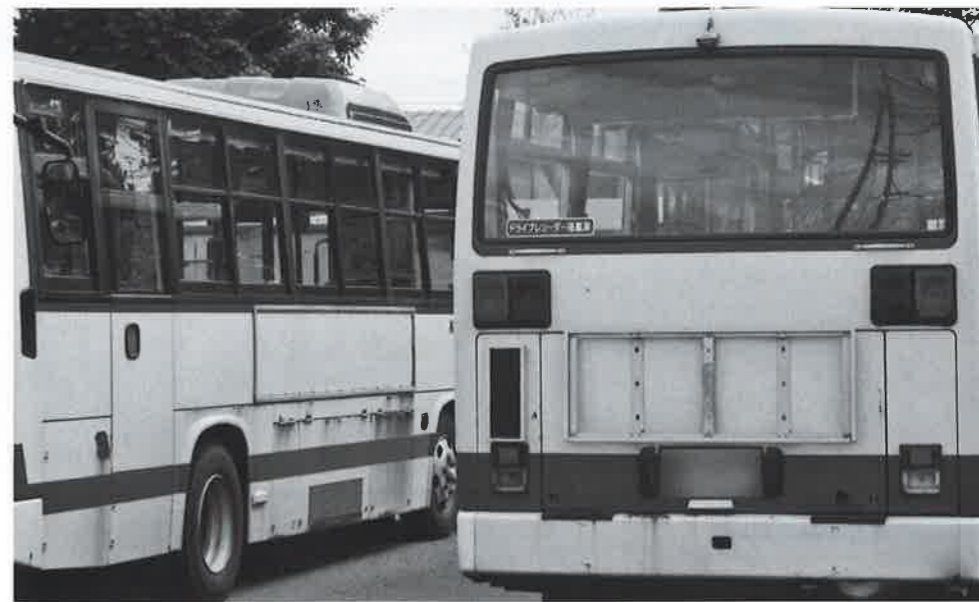
バスの更新はいつ頃？

Q 陸上競技場をはじめとしたスポーツ合宿の入り込みの実態は。 A 30年度の合宿での