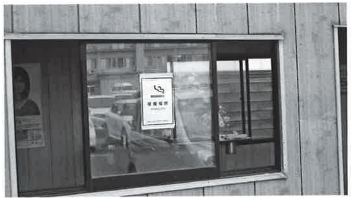
喫煙者のオアシス

教育次長 総合会館には設置してありますが、その他施設への設置の予定はありません。