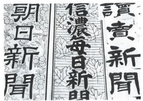
一紙のみは偏向教育では？

教育長 教育課程編成権は校長にあります。教育委員会が学校に対し何々新聞を取りなさいと言うことはあ