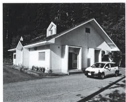
古海浄化センター

病院会計決算 Q 医業外費用雑損失とは。 A 診療の場合、患者さんからは消費税をいただけていません。しかし、薬代等では消費税を支払っていますので、その差を雑損失として計上しています。 Q 理学療法士6名体制は、収益にどのように反映しているのか。 A 地域包括ケア病棟のリハビリや、訪問リハで収益に貢献しています。