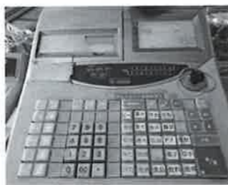
売り手も大変です

質問 6ヶ所の中で話が進んでいるのはどこですか。 総務課長 下山桑地区では地元と合意を得る中で事業がすすめられています。