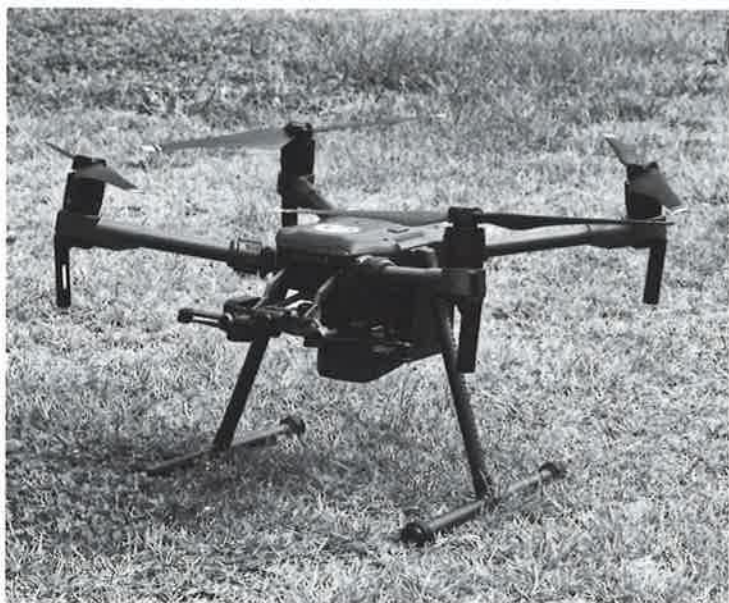
導入されたドローン

て、「要修繕判定Ⅲ」から「予防保全判定Ⅱ」へは、おおむね5年で修繕する計画です。