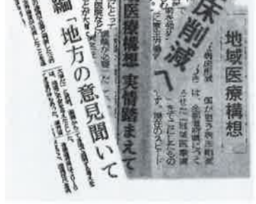
地域の医療に大打撃