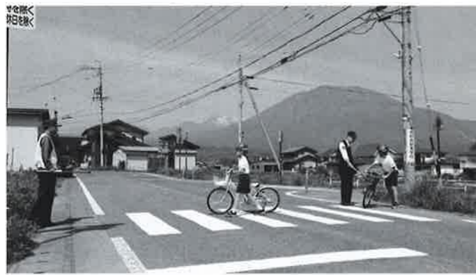
自転車の交通安全教室

対象者は349名で22名が抗体検査を受け、8名が抗体なく、内3名が接種を受けています。