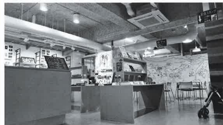
リニューアルされたナウマンゾウ博物館

自治体の「エンゲル係数」と言われるように、町が自由に使える収入のうち、支払わなければならない支出(人件費・社会保障費・公債費など)が占める割合。70~80%が適正といわれます。