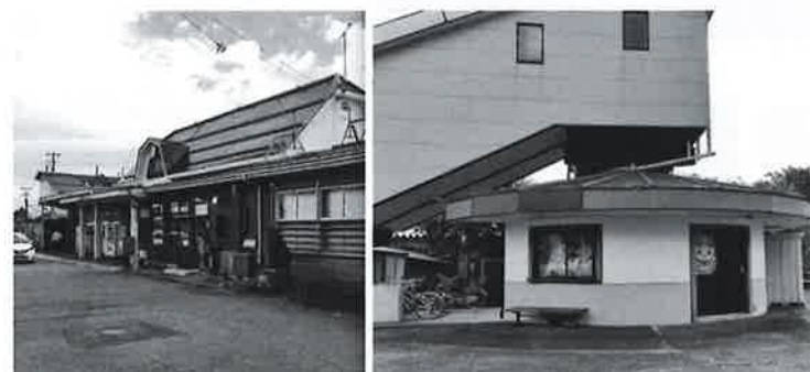
駅にある観光協会（左）と子会社所在地（右）

質問 公益性のある観光協会の社員が、子会社の代表というのはいかがなものか。子会社のことは良く把握していないなら、把握できるような補助金は出した方がいいのでは。補助金、委託金は住民に對してもっと明朝に。 ※他に観光地としての道路整備、県代行事業について質問しました。