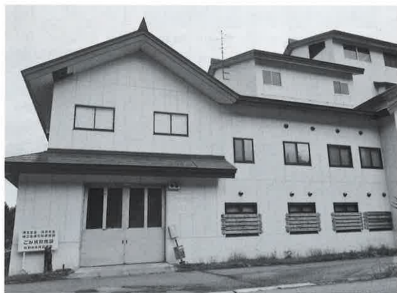
役目を終えた北部クリーンセンター

Q 「ACE健康ポイント事業」について、講演会やウォーキングマップの作成など、予定どおりに行なわれましたか。 A 当初、若干の遅れはありましたが、やるべき事業は年度内に完了しています。