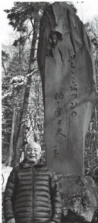
小丸山公園の句碑の前で