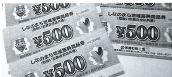
地域を支える商品券

質問 子どもたちの学習 関係、体調管理はどうで すか。 教育長 特に大きな変化 はなく、感染症対策が子