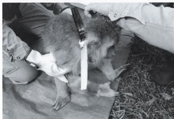
GPSでサルの群れを管理

Q ニホンザルにGPSを付けたことの結果は。 A 3地区で装着を行ない、有害鳥獣対策協議会で実施