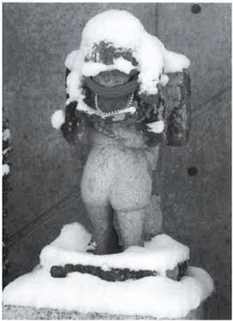
厳しい冬がやってきます

道路除雪作業者に対しては、作業前の検温実施と体調の報告など、感染拡大防止策に関するガイドラインの早急な策定と徹底を望み、コロナ禍にあっても切れ目ない除雪体制が維持されるよう求めます。