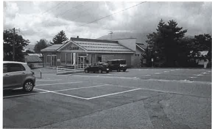
狭くて危険な駐車場

質問 過疎債とは。町長 国として財政支援的な面を含めて応援する、これが大きな主旨の中身の一つです。例えば、100円国から過疎債という借金をする、後々100円内の7割について元利金を国が補填するという制度です。 質問 過疎債は来年3月31日に終了しますが、期限が過ぎて、完成していかなくても申請すれば適用されるのですか。 町長 引き続き、何等かの過疎対策が執行されると踏んでいます。 質問 この過疎債はある自治体では申請の80%しか下りなかったことがありました。信濃町でも認められない金額が出来たとすれば、税金で賄うの