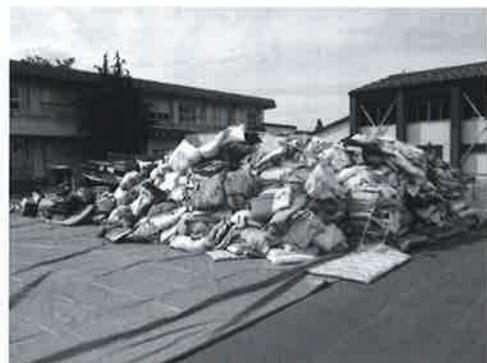
大型可燃ごみの拠点回収

Q 経済的な理由で購入できなかったことから、金券として配るほうがよかつたのではないですか。 A 国の制度上、それはできませんでした。