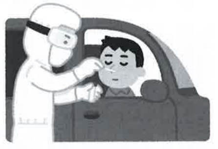
PCR検査をいつでも受けられるように

質問 癒しの森事業について、都市部の感染状況やリモートワークの浸透による影響はありますか。 質問 ワクチンが存在しない今、互いの安全確認は陰性証明だけです。検査体制の充実等、国県に発信していただきたい。町長 必要な部分については、適切に要望していきたいと思えます。