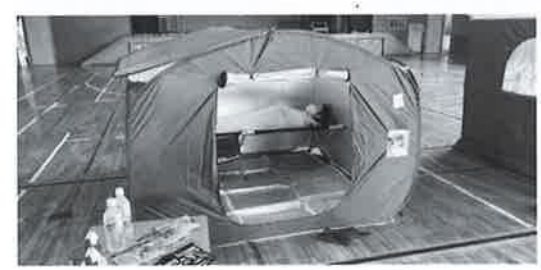
新装備されたコロナ禍対応避難間仕切ルーム

質問 コロナ禍において、行政手続きのオンライン化を進める必要があると思えます。 総務課長 長野県の電子申請サービスを利用していますが、進んでいないのが現状です。マイナンバーカードの活用も視野に入れ、今後検討していきます。