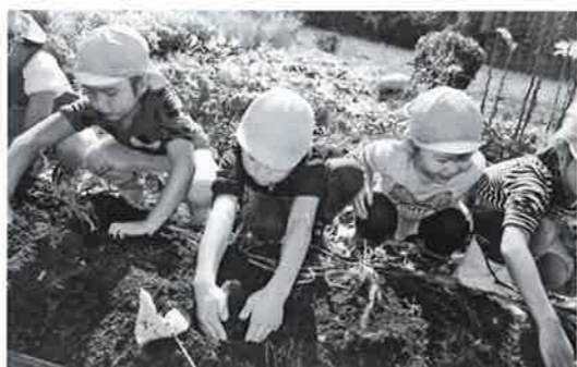
たのしいのしい保育園

Q ナウマンゾウ博物館の入館者について、5月の10連休や新型ウィルスなどによる影響を伺います。 A 入館者数の前年度比は、5月が954人増でしたが、10月が台風19号の影響で1166人減、3月が新型ウィルスによる休館で1109人減でした。