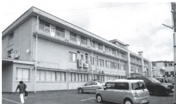
住民合意で進めたい病院建設

ほかに地域振興策を質 しました。 質問 職員の身分証明書 をICカード付きにし て、首から下げることで、 職員の出入りのカウン ト、職員を守る、住民の 信頼度合いも違います。 町長 一つの提案として 興味深く、検討しながら、 絶えず前進あるのみの気 持ちです。