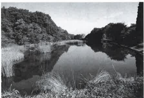
ため池管理責任者は、誰？