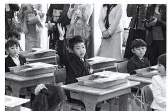
一年生 52人入学おめでとう よく学び よく遊べ

円。捻出することができない金額ではありません。検討してみることがありますか。町長 枠を広げること、今の時点では全く考えておりません。