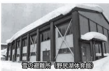
雪の避難所(野尻湖体育館)

総務課長 住民の皆様を生命を脅かす事態への対応と、町で管理するインフラ等の2点です。 冬の避難指定場所への 通路確保の方策は 質問 積雪時、屋根からの落雪や雪庇等で避難指定場所の入口付近は特に危険な状態ですが通路確保の方策は万全ですか。 総務課長 冬期間休館しております古海、野尻湖及び富士里の3体育館とも直接体育館又は旧校舎入口までの通路が確保されており、入ることは可能です。