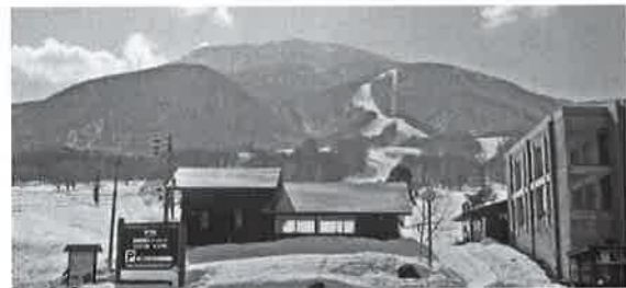
インバウンドに期待 黒姫高原

あつて、オートキャンプ場の利用者が増えていきます。新年度は3台分の整備や、トイレも浄化槽を設ける予定です。