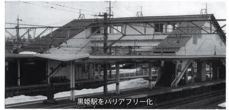
黒姫駅をバリアフリー化

質問 黒姫駅、古間駅のホームの段差改修が設計予算化され、30年に工事となりましたが、黒姫駅の跨線橋を利用しない、1番線利用のバリアフリー化