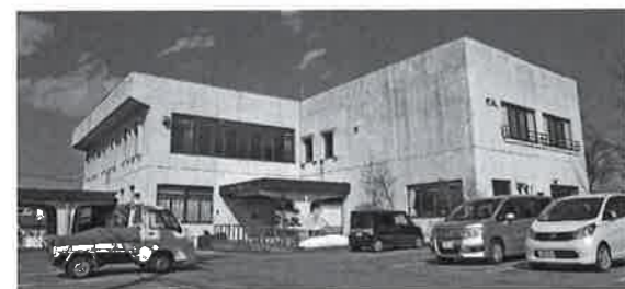
リニューアルを待つ 富士里支館