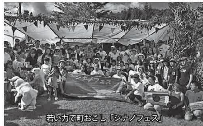
若い力で町おこし「シナノフェス」

質問 高齢者のボランティア活動にポイント制度の創設を提案し「ちよこサポ」として実施され評価しま