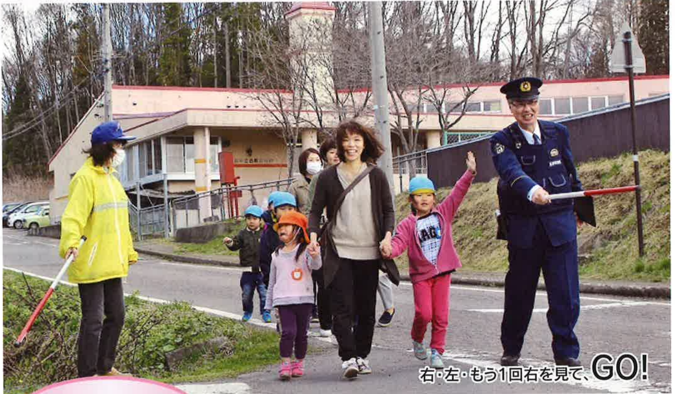
右・左・もう1回右を見て、GO!