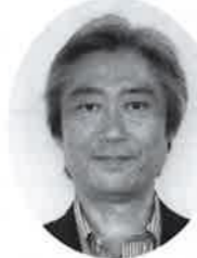
酒井 聡 議員

地域イベントの 増発列車の働きかけは 町長「PRの一つとして 要望していきます」