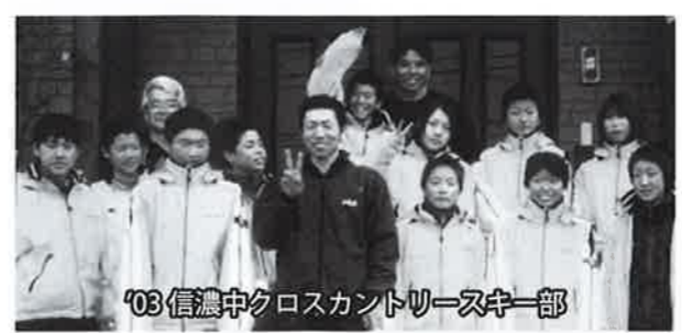
'03信濃中クロスカントリースキー部

質問 5小学校統合から5シーズン目の冬になりました。小中学校のクロスカントリースキーの現状、競技人口及びコーチ体制の把握や強化への考えを伺います。教育次長 現在は授業のみのスキー学習です。部活動の部員数は5名