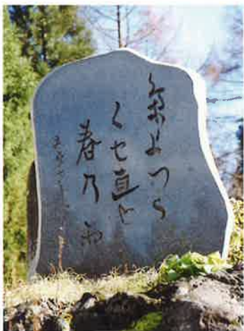
平成11年建立 信濃町野尻山桑 ホテル若月様