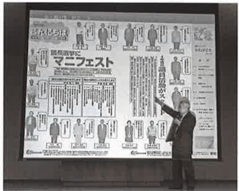
具体的な事例から学ぶ