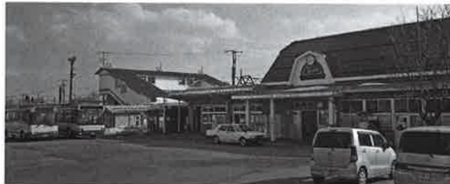
町公共交通の要 黒姫駅

問 野菜生産価格安定基金の利用状況は。 答 事前に補償基準価格等を定めて、価格が下落したときに補てんします。 青果トマトとピーマンを対象にしています。 問 矢保利の館について、今後の経営の予定は。 答 指定管理者の努力も