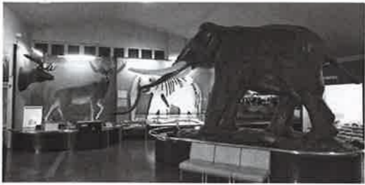
地方創生でリニューアル ナウマンゾウ博物館

問 富士里支館の工事概要を伺います。 答 概ねの改修計画ですが、エレベーターの設置、旧農協事務所部分を部屋に改修します。 2階ステージについても、要望がありますので考えたいと思います。