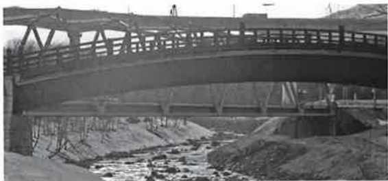
河川の氾濫に十分な備えを