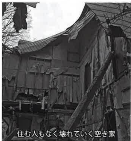
住む人もなく壊れていく空き家