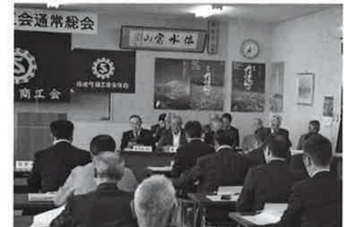
商工業の振興を図る

5月24日の第57回信濃町商工会総会に、議長、副議長、総務産業常任委員長、社会文教常任委員長、議会運営委員長が出席しました。