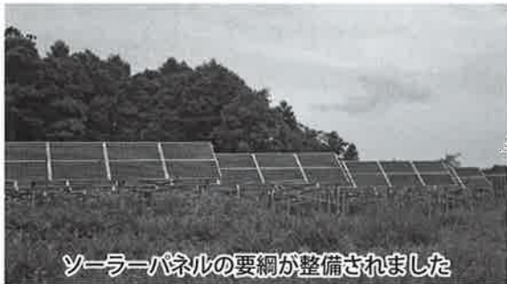
ソーラーパネルの要綱が整備されました

なお、この指導要綱とガイドラインは、意見募集を経て、6月30日付で施行されました。