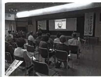
生涯にわたってスポーツを

6月3日、信濃町人権フォーラムが開催され、議員も参加しました。総会後の講演は「スポーツから考える人権」でした。