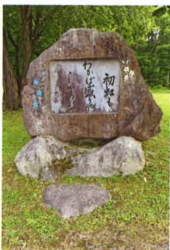
平成20年建立 黒姫童話館