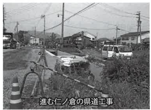
進む仁ノ倉の県道工事