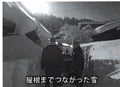
屋根までつながった雪