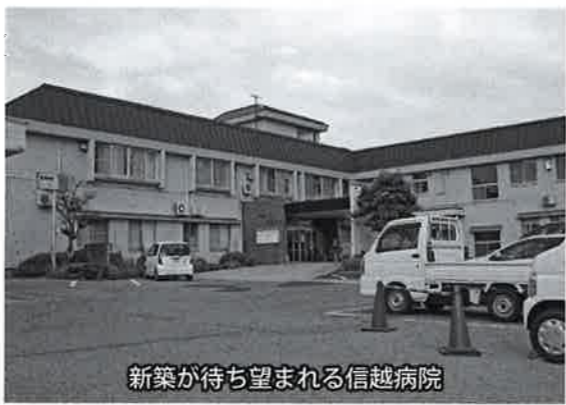
新築が待ち望まれる信越病院

国保世帯の中でも、所得の多い皆さんがおられます。社保の皆さんは3割負担しています。国保のみなさんだけ、こうで