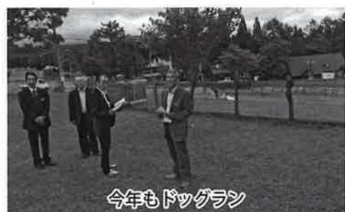
今年もドッグラン