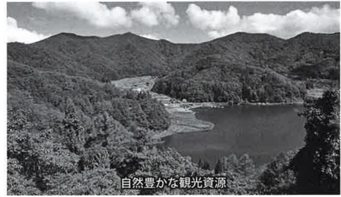
自然豊かな観光資源

質問 NLAが100周年を迎えるが、何か連携は。産業観光課長 参考にしたと思います。質問 インバウンド対策として獅子舞を見せることはいかがですか。産業観光課長 町内の神楽の皆さんの協力を得られるかどうか検討したい。