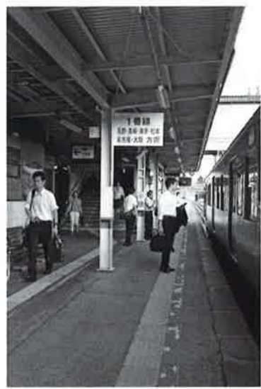
急がれる安全対策

採択した陳情は、町長に送付し、陳情の処理の経過と結果について議会は町長から報告を受けるなどして、議会全体で関心を持ち、その処理状況を確認し