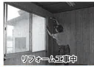
リフォーム工事中

陳情 住宅リフォーム補助制度の継続を。さらに土木関連工事(土止め、外構、舗装)も利用できるよう改正を。 結果 平成29年度も継続します。補助対象等の改正は、過去に補助を受けた方と違いが出てしまったため行ないません。