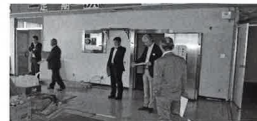
富士里支館の改修でこの部屋も使えるようになります

2 富士里支館については、地元の要望を受け、主に1階部分の大幅改修、エレベーターの設置、バリフリー化、また2階大会議室のステージ改修などが計画されています。 委員会では、文化祭事業が活発に行なわれている地元の要望に応えた計画になっているかどうかを調査しました。