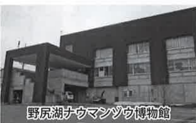
野尻湖ナウマンゾウ博物館