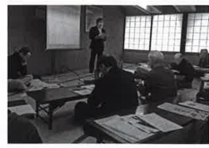
黒姫高原開発の歴史

総会の後、教育委員会事務局の村係長から「黒姫高原開発の歴史」、また児童館の山原学芸員からは、「児童館の歩みと信濃町ゆかりの童話作家」と題する講演がありました。