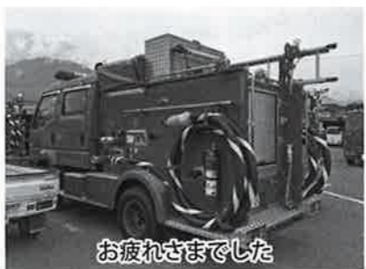
お疲れさまでした