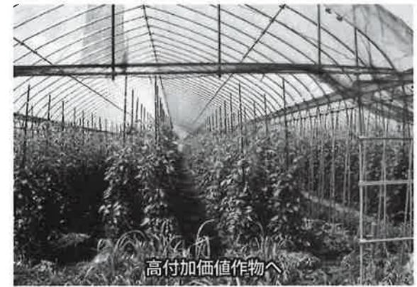
高付加価値作物へ

町長 町は、農業競争力の基盤整備事業や、経営体の育成支援事業等、国の推進する補助事業を導入、引き