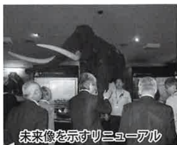
未来像を示すコミュニティ