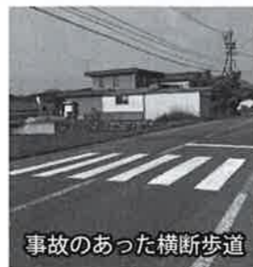
事故のあった横断歩道