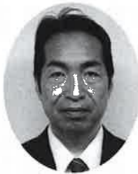
片野 良之 議員