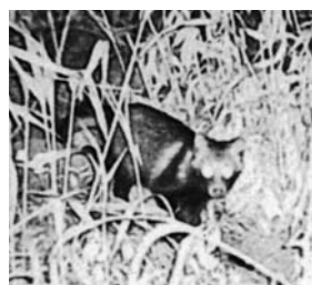
畑に出没したイノシシ

総務課長 4年度までで29件です。起業をやめた方は、総務課長 創業5年以内に廃業された方は2名で交付要綱、廃業に至る経緯、また未到達期間などを把握しまして、返還の請求を進めていきたい。