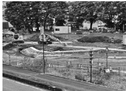
新病院建設中… 内部の体制も新しくしなければ

新しくなっても、中身が伴わなくて患者さんのためにならないような運営体制では、結局困るのは私たち町民です。町立病院はどうあるべきか。しっかりと知識と意見を持つメンバーを配置した運営（経営ではなく）協議会を設置して、改革を進めていただきたい。町長 設置に向けて検討していきたいと思えます。