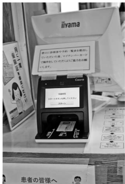
顔認証付きカードリーダー

質問 町長 信越病院の顔認証付きカードリーダーについて、利用率はどのくらいか。病院事務長 7月の時点で、来院数2021人に対してカードの利用者は258人、率にして12・7%です。