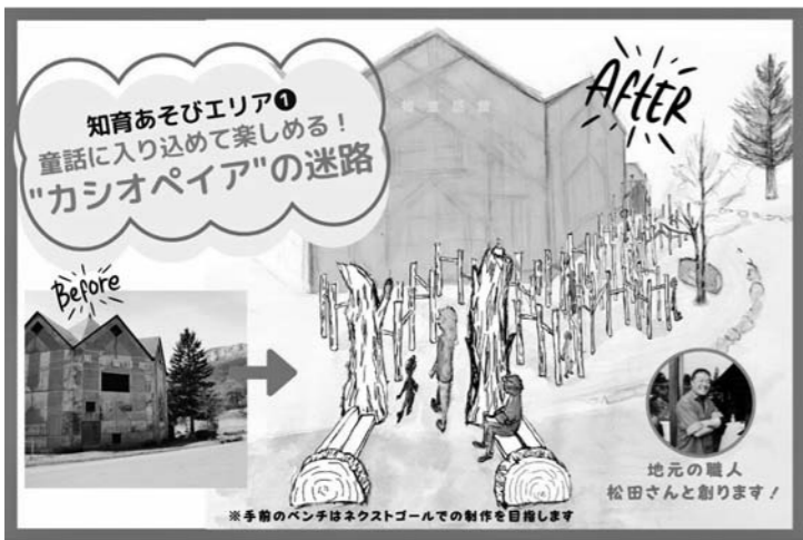
黒姫童話館 "知育遊びあそびエリア" 完成イメージ図

寄附者 黒姫童話館に豊かな心を育む「知育あそびエリア」を作りたい！クラウドファンディング寄附者 153人