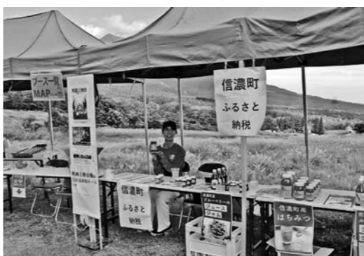
地域の魅力をアピール

A 地域の産品の魅力や価値が寄附金の額に影響すると考えています。寄附額の増加は自主財源の増加に直結します。信濃町