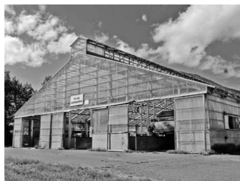
堆肥の量が減っている堆肥センター