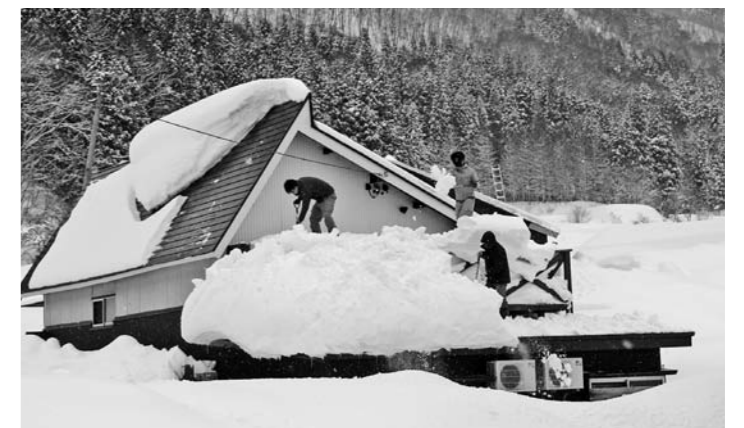
豪雪地帯の雪下ろし

また、除排雪オペレーターの高齢化により、オペレーターの人材確保を計画的に行う必要がありますので、除排雪機械の作業従事に必要な資格取得に要する経費を県費で支援する制度の創設を求めます。