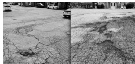
駅前道路の整備は早急に！

質問 駅前周辺の整備をどのように考えますか。町長 人の移動を支える重要インフラと認識し、