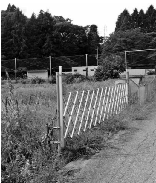
町営野尻湖第2駐車場の前にできた資材置き場

産業観光課長 事前に相談はありませんでした。総務課長 初めて聞きました。 質問 5条転用の審議す