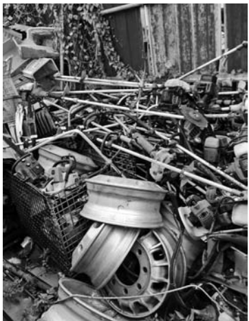
ヤードの中の一例

せん。 質問 条例の中でソーラーパネル設置に縛りを強くしたように、条例をきちんと作って、自分の土地だから何をやるにしても、林野部の無許可な伐採、勝手な造成などというような事は許してはならないのでは。 町長 現時点では考えていないと答えましたが、私も農地だけでなく山林も含めて土地利用が適正に為されることが、景観・環境を守る第一歩だと思います。条例の必要性について、現状をもう一回把握した上で検討したい。 質問 ヤードは視線が遮られ中で何をやっているか分からない。違法な焼却や廃材を埋める等が考えられます。空気中・土中に有害物質が拡散される恐