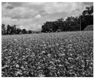
期待されるソバ事業

教育次長 予定額は412人、278万人余り、当初予算の0.49%に相当します。 質問 必要財源が示されました町長の見解は。 町長 来年度予算を編成するにあたり、検討させていただきたい。 質問 無償化を進める上で学校給食法も重要になってきますが、法令的にかかる経費についてどう解釈しますか。 教育長 給食の実施に必要な施設、設備、人件費は町の負担、食材費は保護者の負担ですが設置者の判断で保護者の負担軽減を禁止したのではない。 質問 自治体が全額補助しても学校給食法上何も問題がないということか。 教育長 差支えないと考