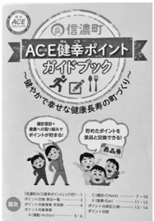
ACE健康ポイントで町を元気に

A 同日に受診できると受診率も上がりますし、良い方法と思いますが、事業団等に委託しており要望してもその通りにはできない状況です。 Q ゴミは、世帯数が減っているのに手数料が増えているのはなぜですか。