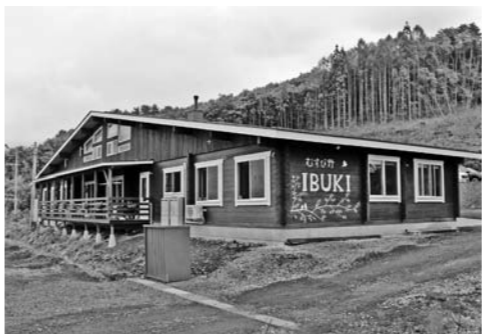
看護小規模多機能型居宅介護施設の充実

Q 終末期支援は決算上反映されていますか。 A 終末期には、訪問看護ヘルパーが入るので他の決算に入ります。