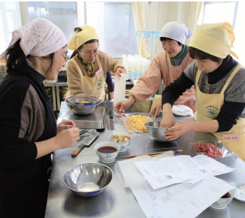
みんなで協力して手際良くお正月料理を作っていました