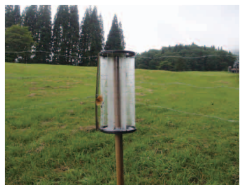
写真②ハエトリ紙の牛用! 結構強力です

が、牛さんも刺す虫は苦手です。たくさん刺す虫に襲われている牛さんは、いつもはのんびり屋の牛さんでもイライラして落ち着きがなくなります。一日中立ったままでしつぽをびゅんびゅん振ったり、虫を追い払うため足をけり上げたりと、ゆっくり座ってもぐもぐ反芻をすることができなくなります。牛さんがイライラしていると、診療のため獣医が牛に近づいただけで、パシッと蹴られることもあります。暑さでストレスがかかっているのに、さらに追い打ちをかけるように刺す虫に襲われたら本当に大変です。人なら、蚊取り線香を焚いたり、網戸の中にいけば大丈夫ですが、牛さんはそうはいきません。でも大丈夫!牛さんがいる牛舎の中はハエや刺す虫は比較的少ないのです。なぜかという、牛舎は大きな扇風機を直接牛の体にあてたり、牛舎をトンネルのようにして風の流れを一方通行にして風を流します。