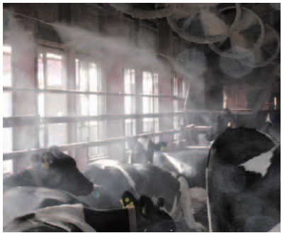
写真①細霧装置で今年の夏は快適だもー!

みなさんこんにちは、8月に入りました。いよいよ夏本番です。牛さんは寒さには強いですが、暑さには弱いので、暑い季節はいかに牛さんを暑さから守るかが重要です。人間は、涼しい場所に移動したり、エアコンの効いた部屋に行くことができますが、牛さんはそう簡単にはいきません。そこで酪農家さんは、扇風機はもちろん、機械で細霧を出し牛舎内の気温を下げたりと牛さんが快適に過ごせるようにしています。この細霧装置、一定間隔で霧を出してくれます。霧が出ると結構涼しいんです。牛さんも気持ちよさそうにしています。