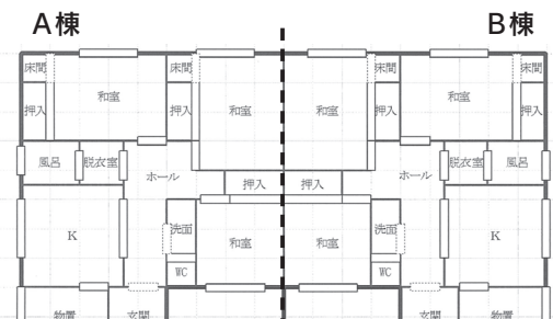
古海仲陣地区 (2戸) 3DK 23,800円/月

図総務課 財政係 ☎(255)5920 【信濃町ホームページ】 http://www.town.shinanomachi.nagano.jp/